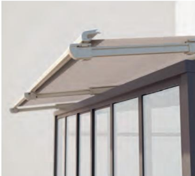
PS6100 Proyección extensible