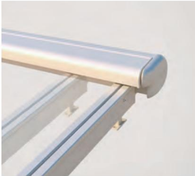
Rieles de guía ajustables